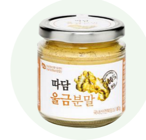
Bột nghệ Ttadam

Bột được làm từ 100% quả dâu tây đen đã được làm đông khô, và được trồng tại vùng Imsil, Jeon Buk