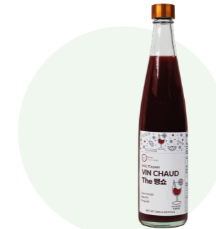
Bong Show hồng sâm trái cây.

Nước ép từ cà chua tươi được người nông dân vùng Imsil, Jeon Buk trồng trong một khu vực sạch sẽ.