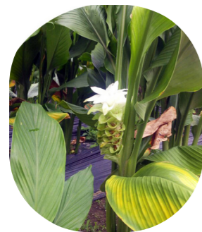
Nông dân trồng nghệ tại vùng Imsil Yang Ok Ja tại nông trại Ul Geum, Imsil

The Cauliflower Mushroom Farm cultivates the mushroom in its fresh state. We aim to deliver goods as it was gifted by nature.