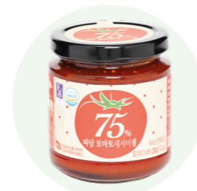
Mứt cà chua Ttadam

Mứt đào tươi được sản xuất từ bàn tay của những người nông dân vùng Imsil tỉnh Jeon Buk