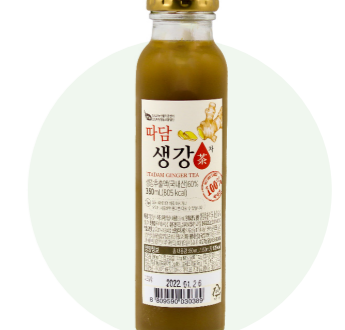
nước gừng Ttadam

Bong Show hồng sâm trái cây không cần được người nông dân vùng Imsil, Jeon Buk trồng trong một khu vực sạch sẽ.