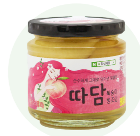
Đào đóng hộp Ttadam

Mứt blueberry tươi ngon được sản xuất từ bàn tay của những người nông dân vùng Imsil tỉnh Jeon Buk