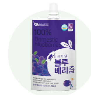
Nước ép blueberry Ttadam

Nước ép từ đào tươi được người nông dân vùng Imsil, Jeon Buk trồng trong một khu vực sạch sẽ.