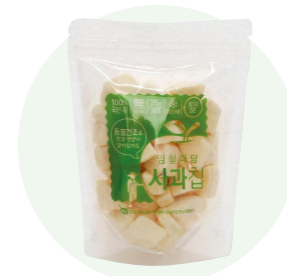
Táo sấy khô

Dâu sấy khô được làm từ dâu tươi, do những người nông dân vùng Imsil, Jeon Buk trồng trong một khu vực sạch sẽ.