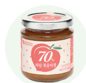
Mứt đào Ttadam

Mứt táo tươi được sản xuất từ bàn tay của những người nông dân vùng Imsil tỉnh Jeon Buk