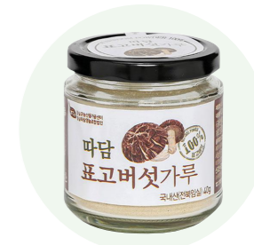
Bột nấm hương Ttadam

Lê sấy khô được làm từ lê tươi, do những người nông dân vùng Imsil, Jeon Buk trồng trong một khu vực sạch sẽ.