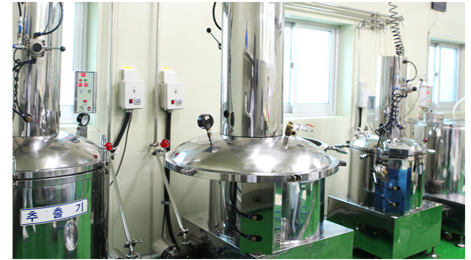
Phòng chuyên dụng đa lưu Đây là nơi chuyên dùng để chế biến nước trái cây và trà, có các thiết bị như máy nghiền, vắt, ép trái cây, và máy chiết xuất. Các thiết bị như máy xay, ép và chiết xuất.