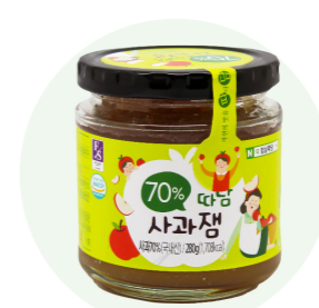
Mứt táo Ttadam

Mứt dâu tây nguyên chất được sản xuất từ bàn tay của những người nông dân vùng Imsil tỉnh Jeon Buk