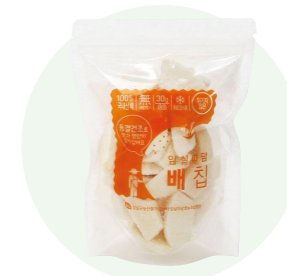
Lê sấy khô

Táo sấy khô được làm từ táo tươi, do những người nông dân vùng Imsil, Jeon Buk trồng trong một khu vực sạch sẽ.