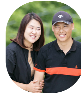
Nông dân vườn phúc bồn tử, vùng Imsil Nông dân trẻ tại vườn Ohbokti, Imsil

Những trái blue berry tại vườn Gwanchon được trồng bởi bàn tay của những người nông dân vùng Imsil. Chúng tôi muốn tặng cho bạn món quà mà thiên nhiên đã tặng chúng tôi.