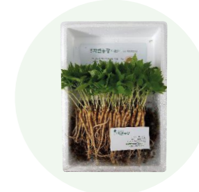
Ttadam một trăm rễ mầm

Bột gừng được chiết xuất từ những củ gừng tươi, do chính tay người nông dân vùng Imsil, tỉnh Jeon Buk trồng được,