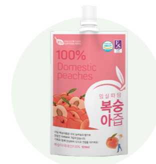
Nước ép đào Ttadam

Nước ép từ táo tươi được người nông dân vùng Imsil, Jeon Buk trồng trong một khu vực sạch sẽ.