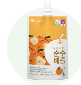
Nước ép lê nguyên chất Ttadam

Nước ép từ lê tươi được người nông dân vùng Imsil, Jeon Buk trồng trong một khu vực sạch sẽ.