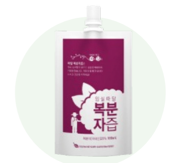
Nước ép phúc bồn tử Ttadam

Nước ép từ blueberry tươi được người nông dân vùng Imsil, Jeon Buk trồng trong một khu vực sạch sẽ.