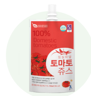
Nước ép cà chua Ttadam

Nước ép từ phúc bồn tử tươi được người nông dân vùng Imsil, Jeon Buk trồng trong một khu vực sạch sẽ.