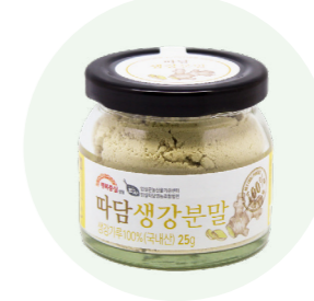
bột gừng Ttadam

Bột được làm từ nghệ tươi, do những người nông dân vùng Imsil, Jeon Buk trồng trong một khu vực sạch sẽ.