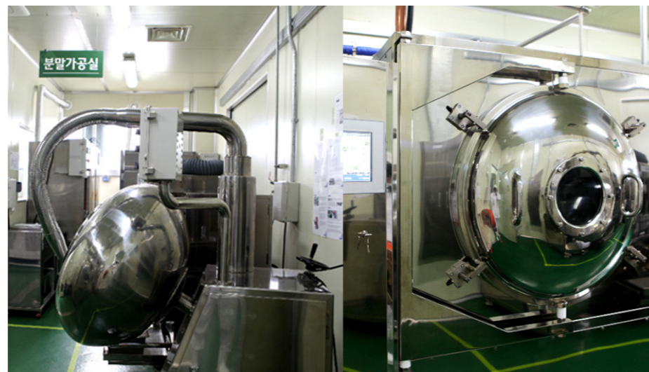
Phòng tạo bột Chúng tôi có cơ sở vật chất hiện đại có thể sấy khô nguyên liệu thô để thực hiện các công đoạn xay bột, pha bột, trộn bột, nghiền bột và chế biến. Các thiết bị máy sấy đông lạnh, máy xay, máy trộn, và máy thông gió.