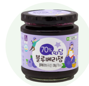
Mứt Blueberry Ttadam

Mứt cà chua nguyên chất được sản xuất từ bàn tay của những người nông dân vùng Imsil tỉnh Jeon Buk