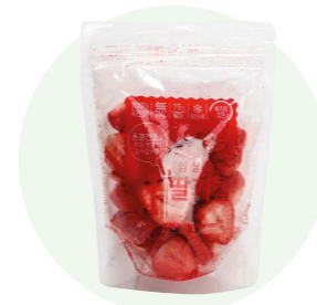
Dâu sấy khô

Dâu sấy khô được làm từ dâu tươi, do những người nông dân vùng Imsil, Jeon Buk trồng trong một khu vực sạch sẽ.