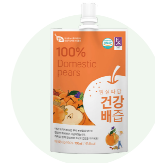
Nước ép lê tốt cho sức khỏe Ttadam

Nước ép từ lê tươi được người nông dân vùng Imsil, Jeon Buk trồng trong một khu vực sạch sẽ.