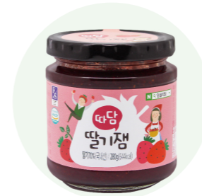
Mứt dâu nguyên chất Ttadam

Mứt dâu tây nguyên chất được sản xuất từ bàn tay của những người nông dân vùng Imsil tỉnh Jeon Buk