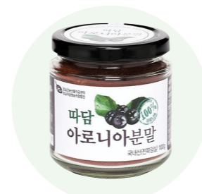
Bột anh đào đen Ttadam

Bột được làm từ nấm hương tươi, do những người nông dân vùng Imsil, Jeon Buk trồng trong một khu vực sạch sẽ.