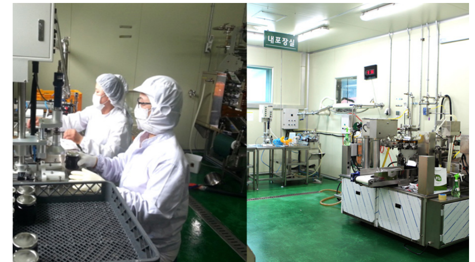
Phòng đóng gói Sau khi chế biến xong, chúng tôi có các thiết bị như máy đóng gói Rotari, máy đóng gói túi Stout Pouch, máy đóng gói Pouch. Các thiết bị máy đóng gói Rotari, máy đóng gói túi Stout Pouch, máy đóng gói Pouch.