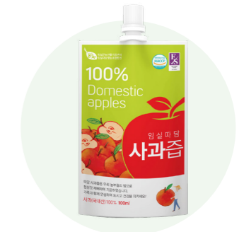
Nước ép táo Ttadam

Nước ép từ lê tươi được người nông dân vùng Imsil, Jeon Buk trồng trong một khu vực sạch sẽ.