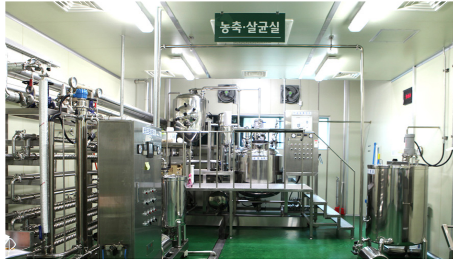
Phòng khử trùng nồng độ Cơ sở vật chất hiện đại sử dụng trong quá trình chế biến, cô đặc, tiệt trùng nguyên liệu Các thiết bị Máy tiệt trùng cô đặc chân không.